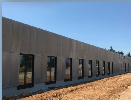
Panneau plein 2000 x 700 x 20 – 67 kg